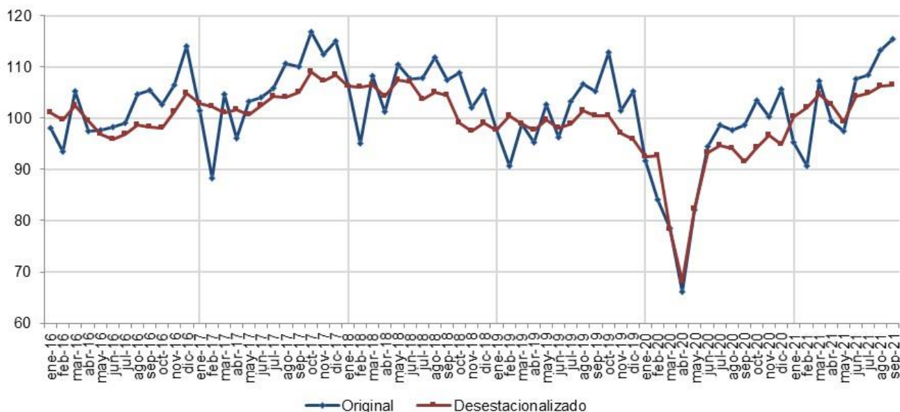
Gráfico 1. Evolución del indicador de facturación. Enero 2011 = 100

Observación: A partir del mes de marzo 2020 se dispuso el aislamiento social, preventivo y obligatorio para mitigar los efectos de la pandemia de COVID-19 afectando a un conjunto significativo de actividades económicas.